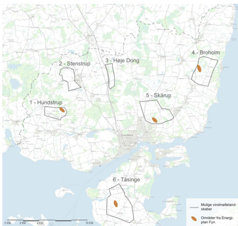
Figur 2: Områder som i Svendborg Kommunes egen analyse fra 2018 blev identificeret som egnede vindmøllelandskaber til opstilling af mindst 3 x 150 m. vindmøller, samt områder fra Energiplan Fyn identificeret som egnede til opstilling af mindst 3 x 125 m. vindmøller.